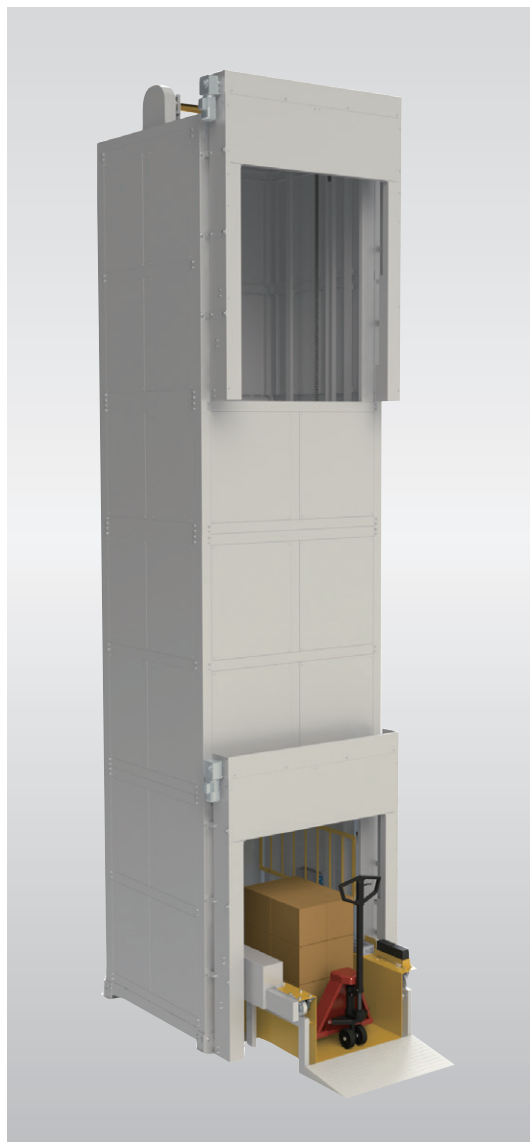
※シャッターはイメージ図となります