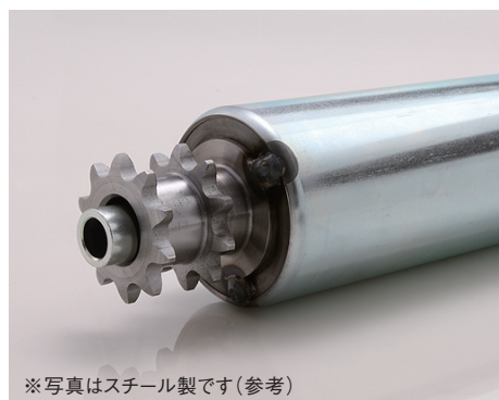
※写真はスチール製です(参考)