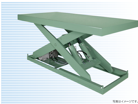
写真はイメージです。