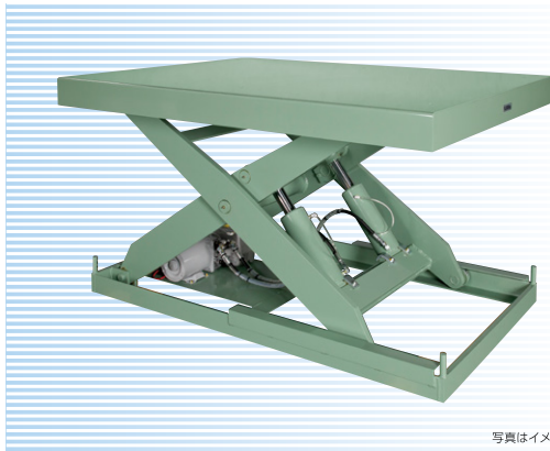
写真はイメージです。