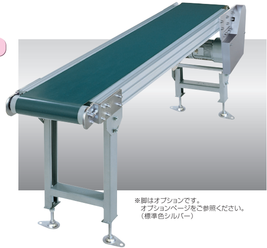
※脚はオプションです。 オプションページをご参照ください。 (標準色シルバー)

90フレームのヘッドドライブタイプで、蛇行レスベルトの採用で、片寄りの少ない安定した搬送を実現しました。