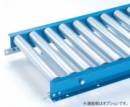
※連結板はオプションです。