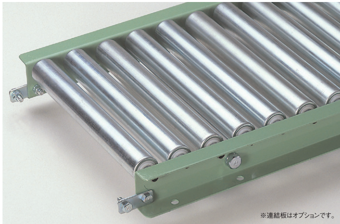
※連結板はオプションです。