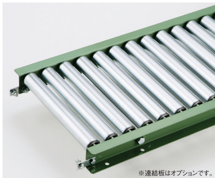
※連結板はオプションです。