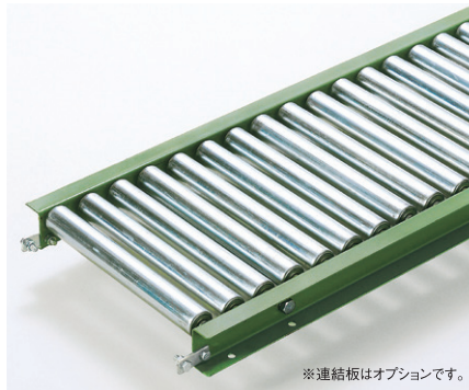
※連結板はオプションです。