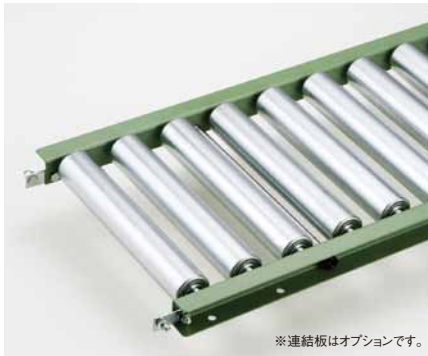
※連結板はオプションです。