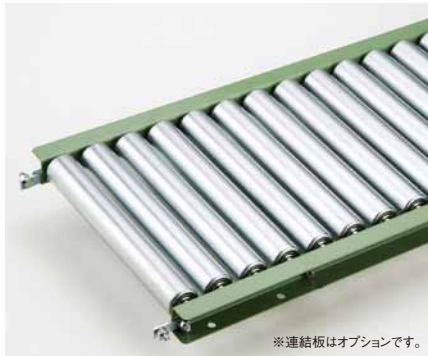
※連結板はオプションです。