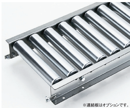
※連結板はオプションです。