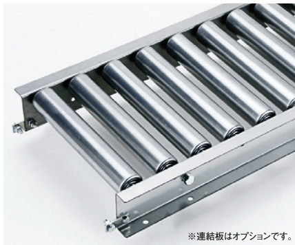
※連結板はオプションです。