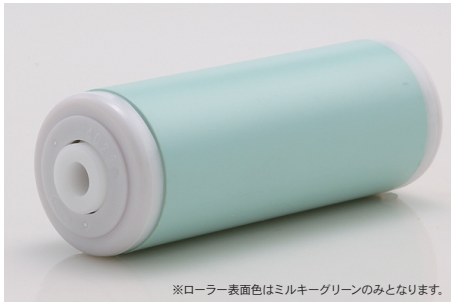
※ローラー表面色はミルキーグリーンのみとなります。