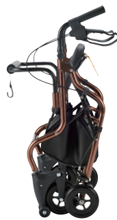
折りたたみ時 (自立します)