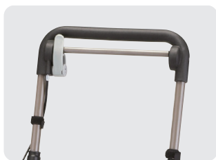
ハンドブレーキ・駐車ブレーキ (バータイプ)