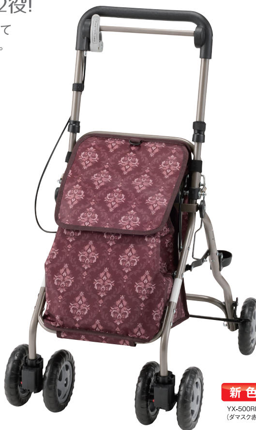
新色 YX-500RD (ダマスク赤)