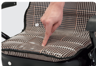
ふんわり座面で快適な座り心地