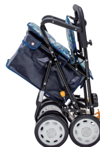
折りたたみ時 (自立します)