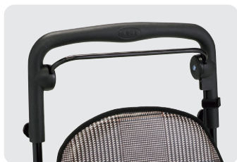
ゆったり広々ハンドル 両手でブレーキバーを握れる為とても安心。