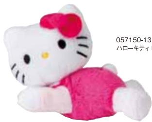
057150-13 ハローキティ ピンク