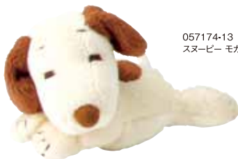
057174-13 スヌービー モカ