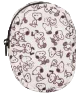
098191-16 スヌーピー 白