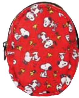
098207-16 スヌーピー 赤