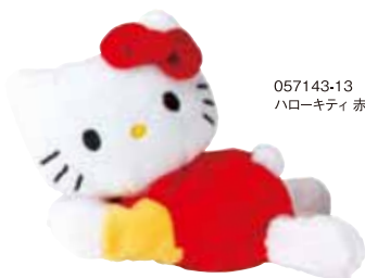
057143-13 ハローキティ 赤

© 2024 SANRIO CO., LTD. APPROVAL NO.L653984